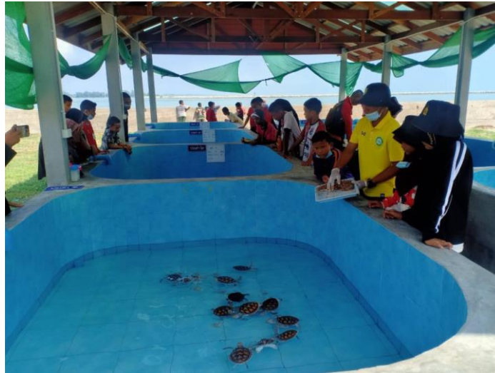
ภาพที่ 3 ศูนย์อนุรักษ์พันธุ์เต่าทะเล ทัพเรือภาคที่ ๒

ตัว 36 นอกจากนี้ในพื้นที่ อ.สัตหีบแล้ว กองทัพเรือก็ยังได้สนับสนุนให้เกิดโครงการอนุรักษ์พันธุ์เต่าทะเลและการปล่อยเต่าในพื้นที่อื่นอีกด้วย เช่น เกาะเต่า จ.ชุมพร 37 และในพื้นที่ของทัพเรือภาคที่ 2 จ.สงขลา เป็นต้น ดังนั้น จึงสามารถเป็นข้อยุติได้ว่า กิจกรรมสนับสนุนดังกล่าวเป็นการแสดงออกถึงบทบาทของกองทัพเรือว่าเป็นส่วนหนึ่งของเศรษฐกิจสีน้ำเงินเช่นกัน