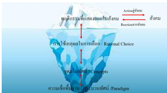
ภาพที่ ๒ ทฤษฎีภูเขาน้ำแข็งของ Spencerในมิติของกระบวนทัศน์กับพฤติกรรมในมุมมองของ Capra

คำว่า “กระบวนทัศน์” โดย Capra (Capra ,๑๙๘๖) ได้ให้นิยามความหมายของกระบวนทัศน์ หมายถึง มโนทัศน์ (concepts) ค่านิยม (value) การรับรู้ (perceptions) และ การปฏิบัติ (practices) ที่ชุมชน (community) หนึ่งมีหรือกระทำร่วมกัน ซึ่งก่อให้เกิดวิสัยทัศน์ (vision) แห่งความเป็นจริง ที่เป็นพื้นฐานของการจัดระบบตนเองของชุมชน โดยกระบวนทัศน์จะเป็นพื้นฐานในการนิยามความหมายของคำต่างๆเช่น “ทะเล” “ผลประโยชน์ทางทะเล” “อำนาจ” “อัตลักษณ์” “จริยธรรมที่กำกับการเลือกอย่างมีเหตุผล” จนนำไปสู่รูปแบบของพฤติกรรมที่แสดงออกของแต่ละประเทศในสังคมนระหว่างประเทศในที่สุด รูปแบบความสัมพันธ์นี้แสดงผ่านภาพที่ ๒ ทฤษฎีภูเขาน้ำแข็งของ Spencerในมิติของกระบวนทัศน์กับพฤติกรรมในมุมมองของ Capra